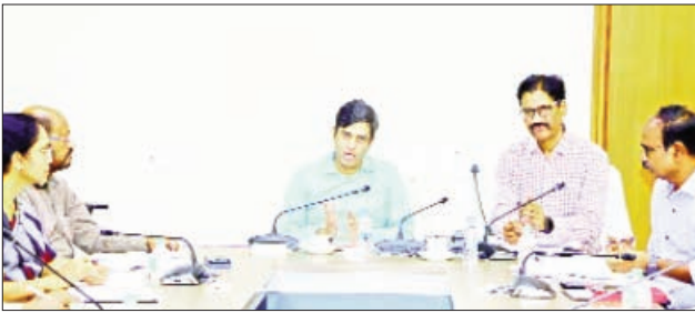
యాదాద్రి భువనగిరి బ్యూరో ప్రభాతవార్త