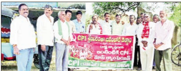
రాజుపేట, ఏప్రిల్ 8 ప్రభాతవార్త